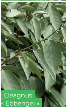
Eleagnus « Ebbengei »