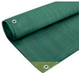
Brise-vue style « tissu », à éviter

modèles dans le commerce, nous vous recommandons d'éviter les modèles en style « tissu » pour favoriser les modèles en matière naturelle ou des haies artificielles , plus esthétiques, et pas forcément plus onéreux.